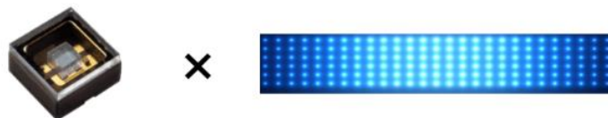
【業界最高出力 ※3 深紫外線 LED と ユニット化技術の融合】