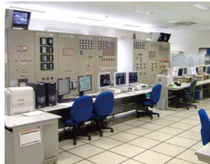
中央操作室 Central control and operation room