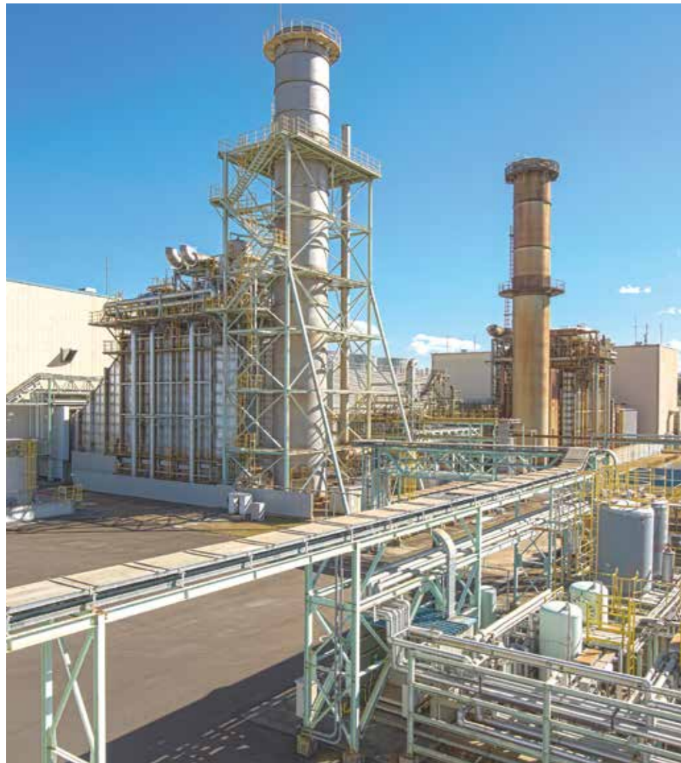
奥：2号発電設備、手前：3号発電設備 Back: Unit 2 GTCC Power Unit, Front: Unit 3 GTCC Power Unit

Type: Single Shaft Gas Turbine Combined Cycle Plant Output: 112,300kW COD: June 1, 2006 Plant Efficiency: 46.8% (LHV base) Fuel: Liquefied Natural Gas (LNG) Operation Pattern: Middle (30%), Daily Start & Stop Main Equipment: ● Gas Turbine Manufacturer: General Electric Type: Heavy Duty Open Cycle (F6FA.03 MNQC) Output / Speed: 78,800kW / 5,231min -1 ● Steam Turbine Manufacturer: General Electric Type: Single Pressure Single Flow Condensing Impulse Type Output / Pressure Steam: 33,500kW / 6.1MPa, 510°C ● Heat Recovery Steam Generator Manufacturer: IMEX (JAPAN) Type: Dual Pressure, Natural Circulation High Pressure Steam: 105.5t/h, 8.2MPa, 519°C ● Generator Manufacturer: General Electric Type: 3 phase, Synchronous Generator Capacity: 124,777kVA ● Auxiliaries Cooling Tower, De-mineralized Water unit, LNG Satellite Station, Fuel Skid, LO Skid, Transformer, EHV Substation, Inlet air cooling system, Control Panel & Instrument, etc.