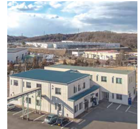
管理事務所棟 Office buildings