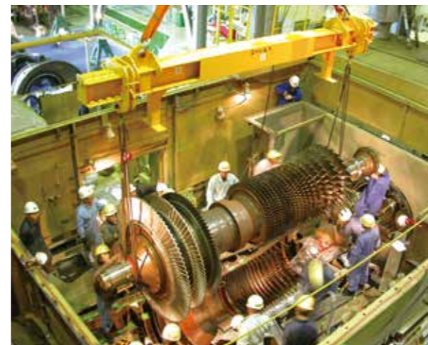
ガスタービン開放点検の様子 Overhaul of gas turbine