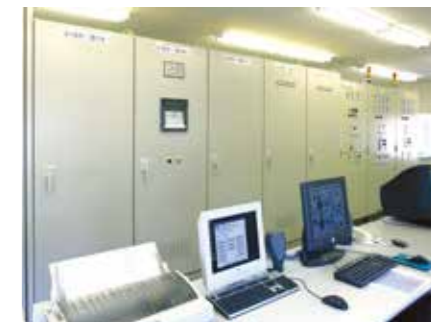
操作室 Control and operation room