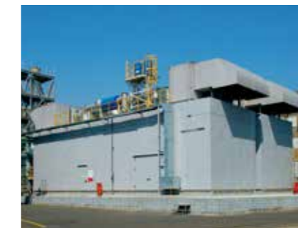
エンジン発電機パッケージ外観 Exterior appearance of gas engine power package