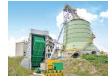
燃料受入ホッパ Fuel receiving hopper