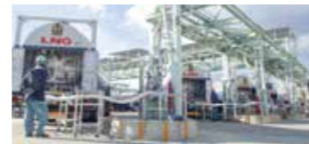
LNG荷卸しの様子 LNG unloading