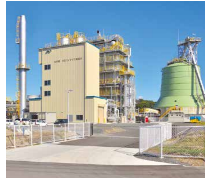
宮の郷発電所全景 Overview of Miyanosato Power Station

Type：Wood Fuel Chip Burning Boiler- Turbine Power Unit Plant Output：5,750kW OOD：November 1, 2015 Plant Efficiency：21.91%（LHV base） Fuel：Wood chip（Local unused materials） Operation Pattern：24hour（8,000h/a） Main Equipment：●Furnac & Boiler Manufacturer：Kurabou（Japan）, IMEX（Japan） Combustion System：Bubbling fluidized bed（BFB） Boiler Type：Corner Tube High Pressure Steam：24.98t/h, 6.0MPa, 450℃ ●Steam Turbine Manufacturer：MAN Diesel & Turbo Type：Condensing Extraction Turbine of Impulse Type Output/Pressure Steam：5,750kW, 24.98t/h, 5.8MPa, 447℃ ●Generator Manufacturer：TD Power Systems Type：3 Phase, Brushless Synchronous Generator Capacity：6,389kVA ●Auxiliaries Cooling Tower, Primary Air Fan（PAF）, Induced Draft Fan（IDF）, Dust Collector（Bag Filter）, Fly Ash handling System