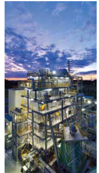
流動床炉ボイラ設備 Fluidized bed furnace boiler