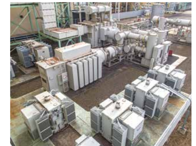
受変電設備(3号機) Substation (Unit 3)