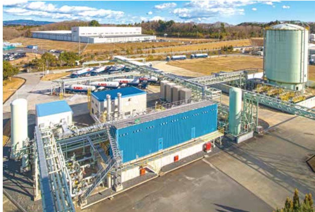
LNGサテライト全景 Overview of LNG Satellite Station

Capacity：40t/h（max.500t/day） COD：November 19, 2012 Fuel：Liquefied Natural Gas（LNG） Operation Pattern：Daily Start & Stop Main Equipment：●LNG Storage Tank Type：Vertical Cylindrical, Perlite Insulation Capacity：2,400m 3 ●LNG Pump Type：Submerged Pump Capacity：50.6m 3 /h, 3.2 MPa, 4Units ●LNG Vaporizer TYPE：Open Rack type（ORV） Capacity：20t/h Main2+Spare1 ●Receiving Station Number of Nozzle：10 ●Auxiliaries Gas governing tank, Pressure evaporator, Boil of gas heating system, Water heater, Control panel, others.