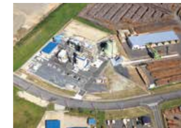
発電所に併設する燃料供給設備 Fuel skid adjoining to power station