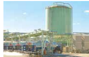
LNG貯槽とローリーステーション LNG storage tank and receiving station