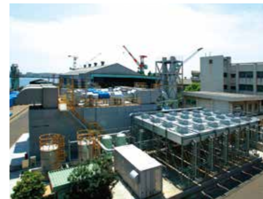
発電所外観 Exterior appearance of power station

Type：Diesel Cycle Plant Output：29,460kW（6,000kWx2）（8,730kWx2） COD：2002（Unit1,2） / 2008（Unit3,4） Fuel：Town Gas（13A） Operation Pattern：Peak Cut, Normally Standby Main Equipment：●Diesel Engine Manufacturer：Wartsila Type：18V34SG（Unit1,2） / 20V34SG（Unit3,4） Output / Speed：6,000kW, 8,730kW / 750min -1 ●Generator Manufacturer：ABB Type：3 phase, Synchronous Generator Capacity：7,500kVA, 9,000kVA ●NOx Removal System Manufacturer：Hitachi Zosen TYPE：Selective Catalytic Reduction（SCR） Efficiency：90%（32ppn@O 2 =0%） ●Auxiliaries Cooling Radiator, Ammonia Supply Device for Denitration, LO Skid, Air Starter Unit, Transformer, EHV Substation, Control Panel & Instrument, others.