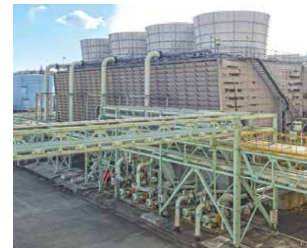
冷却塔設備(3号機) Cooling tower (Unit 3)