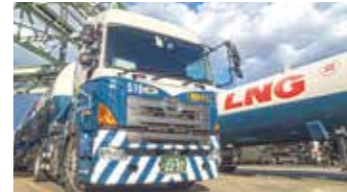
LNGタンクローリー LNG tanker