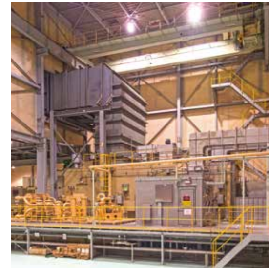
ガスタービン設備(2号機) Gas turbine (Unit 2)